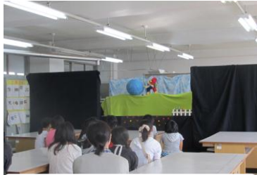
人形劇「ぐりとぐらの遠足」