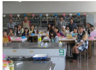
みんな笑顔の記念撮影