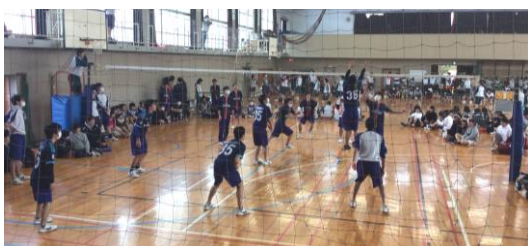
窓を開けて換気に配慮しながらの体育館種目

め臨時休校の措置をとりました。保護者の皆様にはご心配をおかけしましたが、12 月 28 日に栄福祉保健センターから終息宣言が出されたことをご報告します。ただ、今後も流行が懸念されていますので油断は禁物です。例えばノロウィルスの場合、ウィルスが体内に入らないように注意することはもちろん大切ですが、症状のある人に対して気をつけるだけでは不十分のようです。ウィルスは体内に入ったとしてもすべての人が発症するわけではありません。ウィルスに感染した人のうち発症するのは約半数で、半数は症状が出ないようですが（不顕性感染と呼びます）、この不顕性感染の人の便などにもウィルスが排出されると聞きます。つまり、家族や周囲の人たちに症状が出ていなくても注意を怠るべきではないということです。また、毎年 1 月から 3 月は、感染性胃腸炎だけでなくインフルエンザなどの感染症が流行する時期です。外出時にマスクを着用する、帰宅時には手洗いやうがいをするなどの予防をしっかり行うのは当然ですが、その前に、まずは自身の生活習慣を見直すことも大切でしょう。栄養バランスの取れた食事と規則正しい生活リズムを心がけ、感染しにくく抵抗力のある体づくりこそ最も大事なことだと思います。自分の体の声に耳を傾け、年度末のこれからを元気に乗り切れるよう、ご家庭でのご協力もよろしくお祈りします。